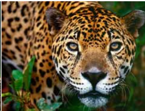
Jaguar o Balam, signo de los linajes mayores

Los conocimientos detallados sobre Chicruz se deben a la excavación nítida del edificio más interesante, la pirámide central. Encontraron un animal estucado asentado sobre las últimas gradas de la pirámide. El arqueólogo en cuestión, Alain Ichon, lo identificó como jaguar, debido a similitudes con otros hallazgos en la región, la supuesta función sacrificial del conjunto y el vínculo de este felino con el inframundo, ya que "el jaguar, en tanto que deidad infernal, está designado a acoger a los muertos en su mundo subterráneo" . Sin embargo, reconoció que la escultura parece "más reptil que felino por sus miembros posteriores" . Desde entonces, se habla del "Jaguar de Chicruz", a pesar de que a la figura le falta un rasgo muy importante para poder identificarla con seguridad: la cabeza.