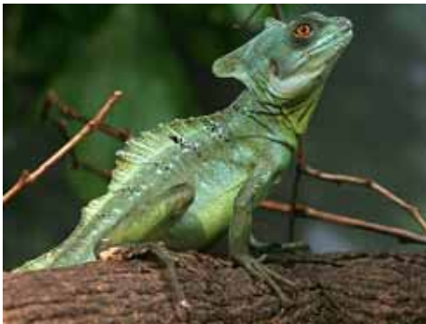
Iguana "Oregón" ( Basiliscus plumifrons )